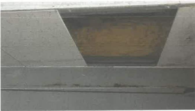
유료락카실 천정누수 텍스분리 및 보수