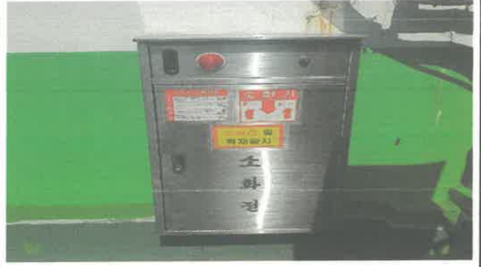
욕상 소화전함 설치