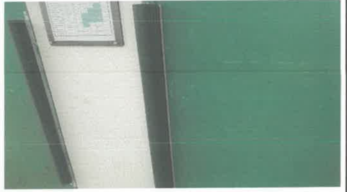
2층 프로1실 출입문 안전리브 수리