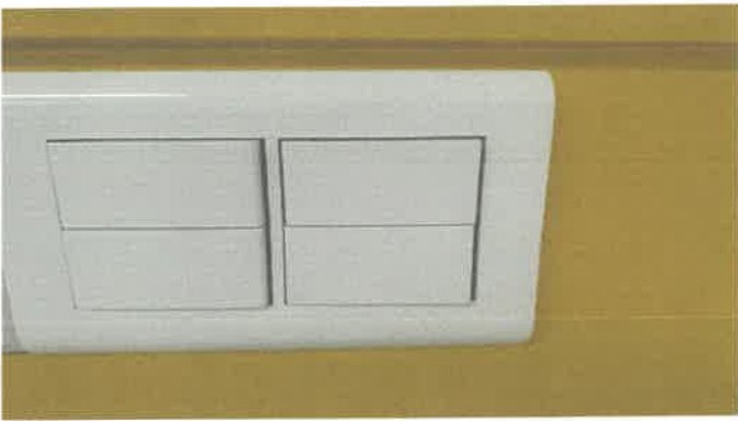
2층 전등커버 4구스위치 교체