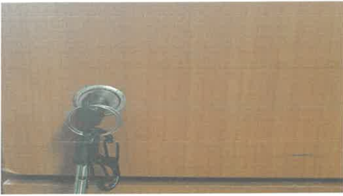
3층 피아노실 수납장 시건장치 보수