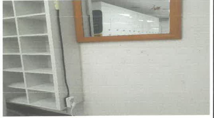
수영장 여자탈의실 멀티탭 설치